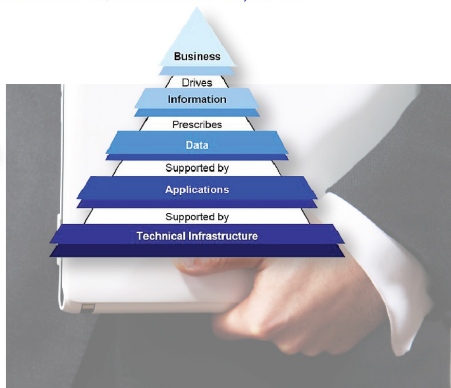
Enterprise Architecture FrameWork

สถาบันวิทยาการ สวทช. และ หลักสูตรสถาปัตยกรรมการจัดการองค์กร คณะวิศวกรรมศาสตร์ มหาวิทยาลัยมหิดล