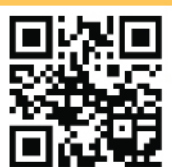
Image Ref: https://blog.ourgreenfish.com/th/what-is-digital-transformation-business-world